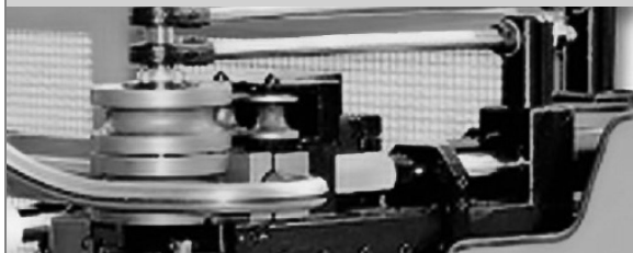
PROVAR 5 U-D