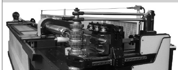
PROVAR 6 U-D