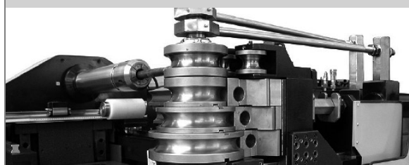
PROVAR 6 U-D